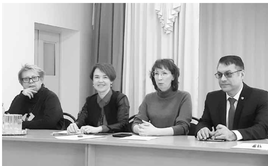
Учредители и организаторы «Воспитателя года» обсуждают подготовку к всероссийскому финалу

Готовятся к конкурсу и детские сады, в которые поедут сопровождающие, пока их подопечные конкурсанты будут работать