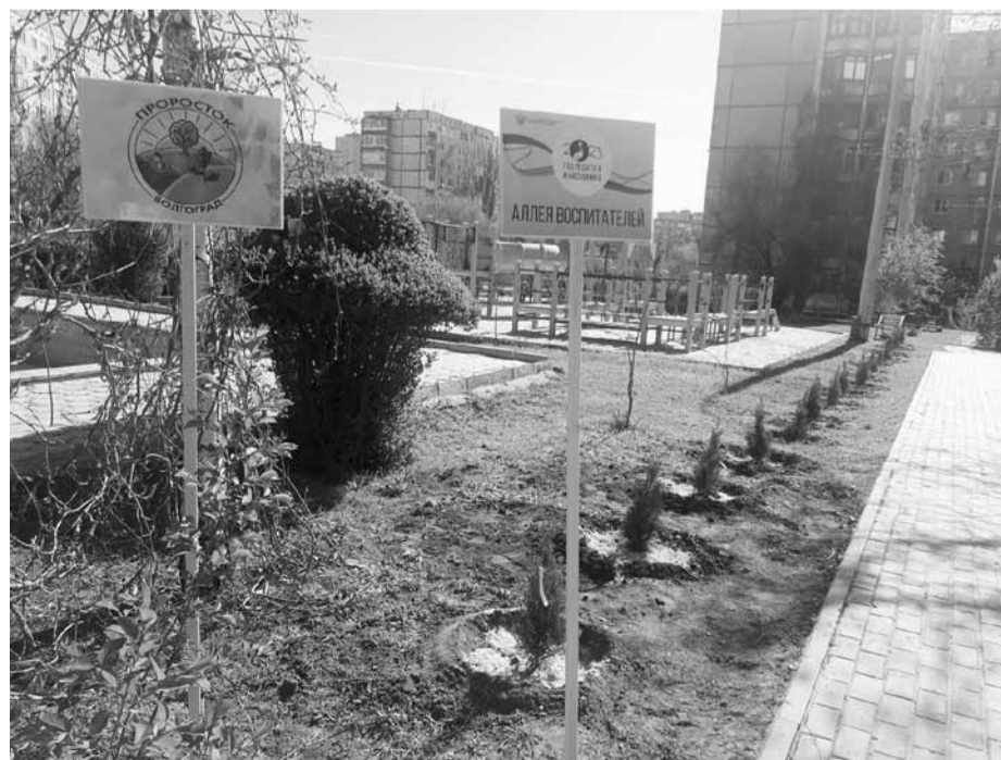
Так выглядела аллея воспитателей года сразу после закладки, весной 2023-го