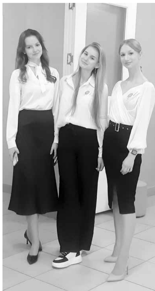
Старшеклассники 77-й школы выступают на конкурсе в роли волонтеров

Город-герой Волгоград к приему гостей готов