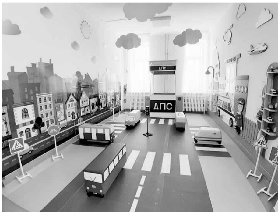
В этом пространстве детского сада №3 ребята изучают правила дорожного движения