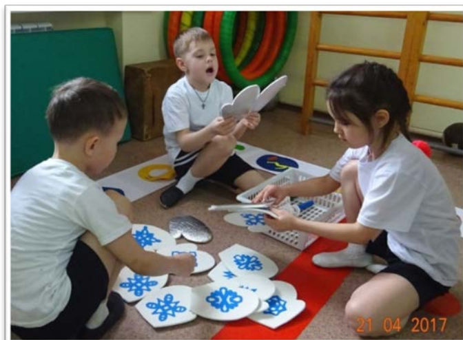
Игровое задание «Найди пару»