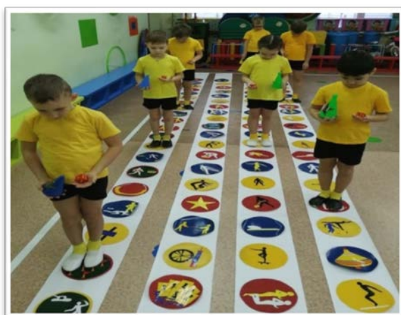
Знакомство с игрой