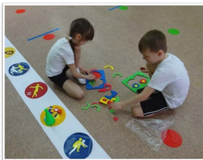
Игровое задание «Сложи пазлы»