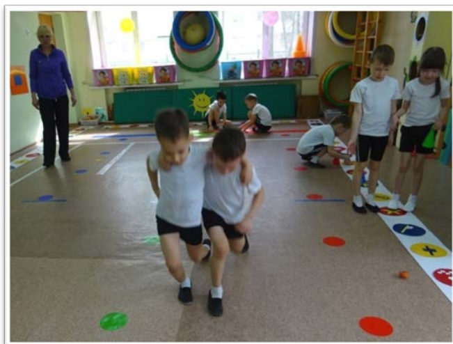
Игровое задание «Дружная пара»