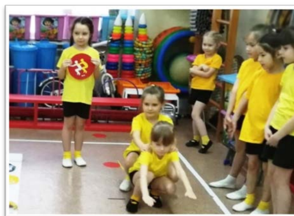
Игровое задание «Гуси»